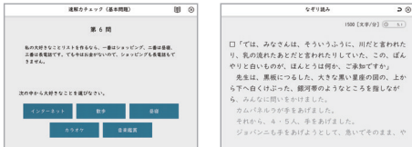
速読解力トレーニング

一人一人の読書スピードに合わせた速読トレーニングを基本に、国語系、算数系それぞれのトレーニングを通して「読み解く力」「考え抜く力」を総合的に鍛える体験をします。